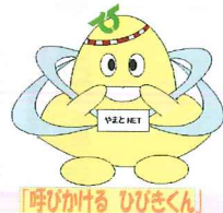
呼びかける ひびくん