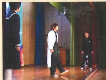
になるか楽しみです。

今年のオープニングは、去年と違ってすごいおもしろかったです。特に最初の画面とお話する!! みたいなどころでは、皆スゴクニコニコ顔でした。ガリレオが出てきたり、皆で5・4・3・2・1と言ったり、本当におもしろかったです。誰もが一緒に楽しめるオープニングでした。保護者の方々も笑っていたし、会場の中は笑いで一杯でした。私も去年は実行委員でしたが、今年のほうが完成度はすごく高かったです。私は来年、絶対に実行委員をやりたいです。見るのも楽しいけど、作るのも達成感があっていいだろうなと思います。来年はどんな文化祭