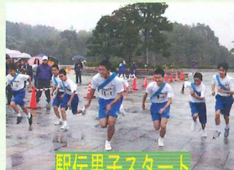
駅伝男子スタート

朝から空模様ははっきりとしない天気でしたが、6:00に小雨決行ということで、ここからが準備に向けて大忙しでした。事前に準備はしていたものの、あらためて生徒たちが雨の中を走るということをシュミレーションしながら、必要物品を車に積み込み、会場となる大和総合スポーツセンターに出発しました。生徒たちも、集合時間の8:20にはスポーツセンターに集合し、メインフロアで健康観察と諸注意、チームごとに細かな打合せを行い、開会式に臨みました。9:40、スタートの号砲とともに、まず女子チームの1区選手14人が勢いよく飛び出し、2kmと1、7kmの計5区間で健脚を競いました。10:40には男子が、そして、最後にフリーの部27人が2kmで勝負を競いました。多くの保護者の方が小雨の振る中、応援に駆けつけ、熱心に応援をしてくれました。ありがとうございました。